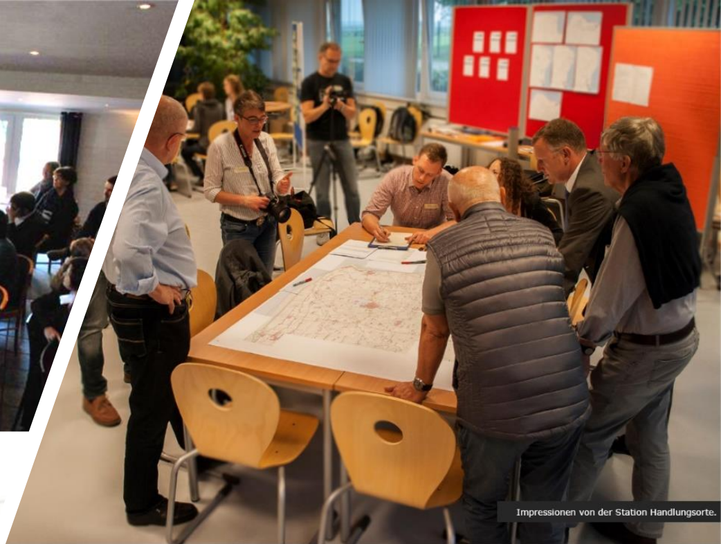
Impressionen von der Station Handlungsorte.